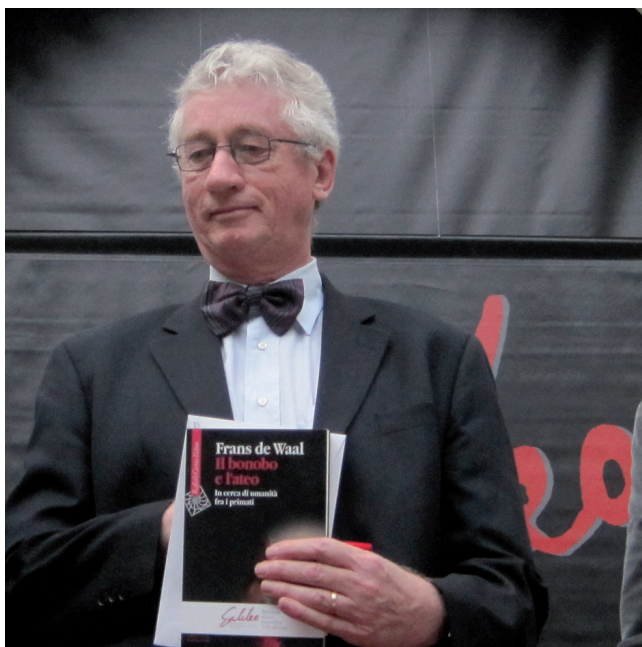
Il vincitore dell' VIII edizione del Premio Galileo, Frans de Waal con Il bonobo e l'ateo , edito da Raffaello Cortina Editore